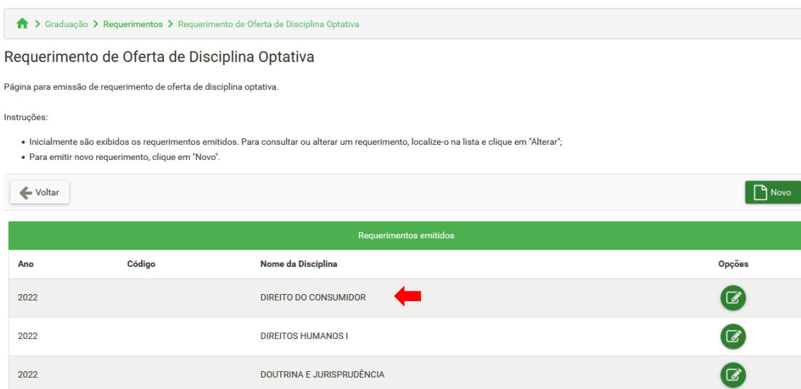
Figura 12 – Lista de requerimentos emitidos