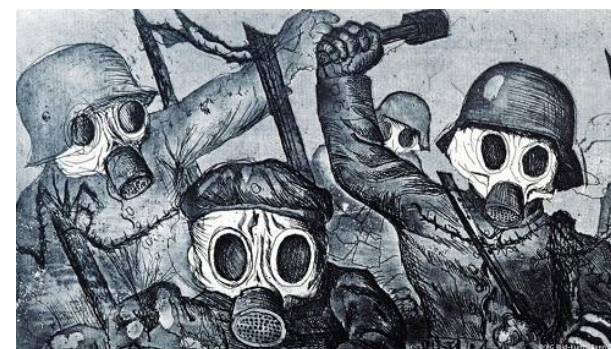
"Tropa de ataque avança sob gás" Otto Dix (1891-1969)

Fotografias – Arte – Jogos Eletrônicos – Documentários – Canções