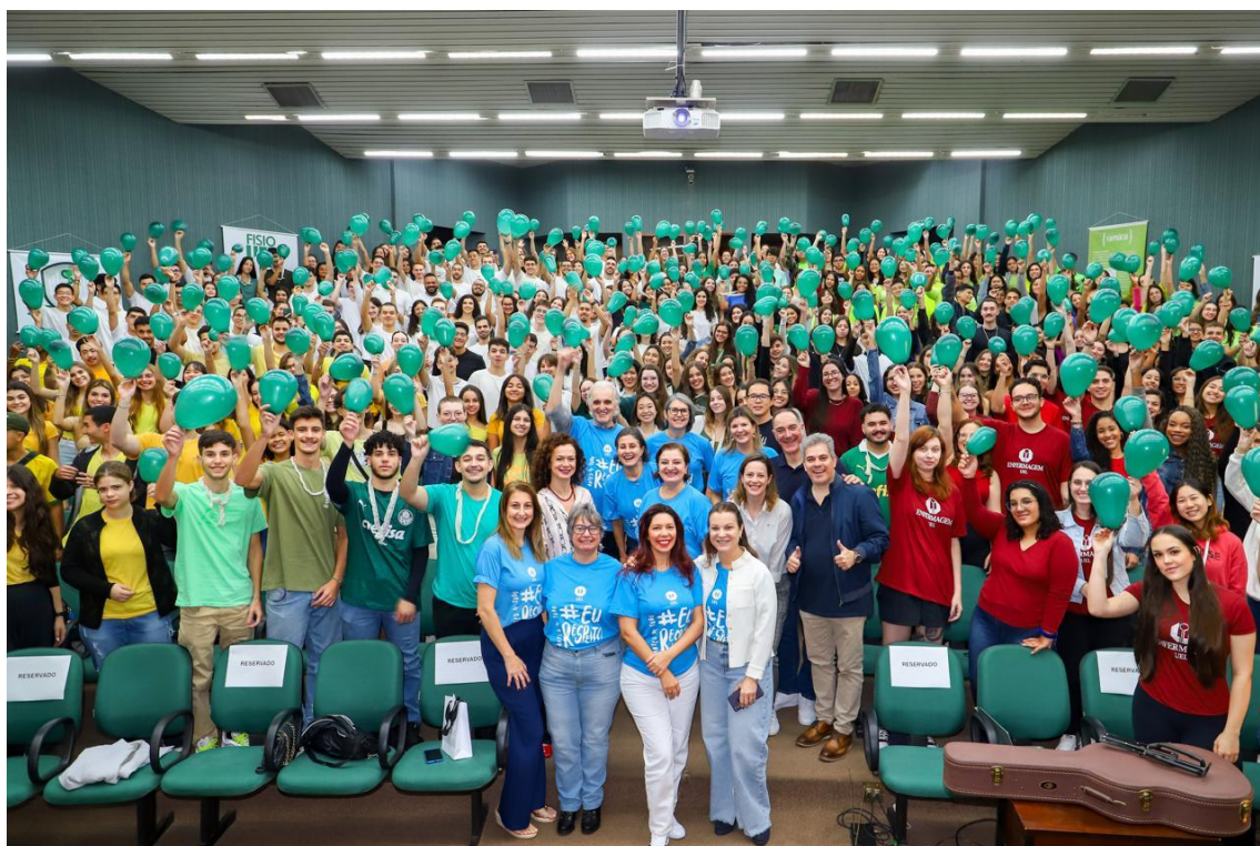
Figura 19: Recepção aos Ingressantes dos Cursos da Saúde (2024)