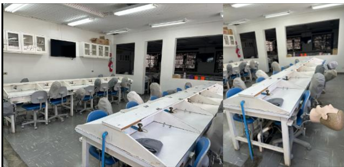
Figura 10: Laboratório de Habilidades Odontológicas I localizado na Clínica Odontológica Universitária - Centro.

Legenda: Sob coordenação da Direção do CCS e da Clínica Odontológica Universitária.