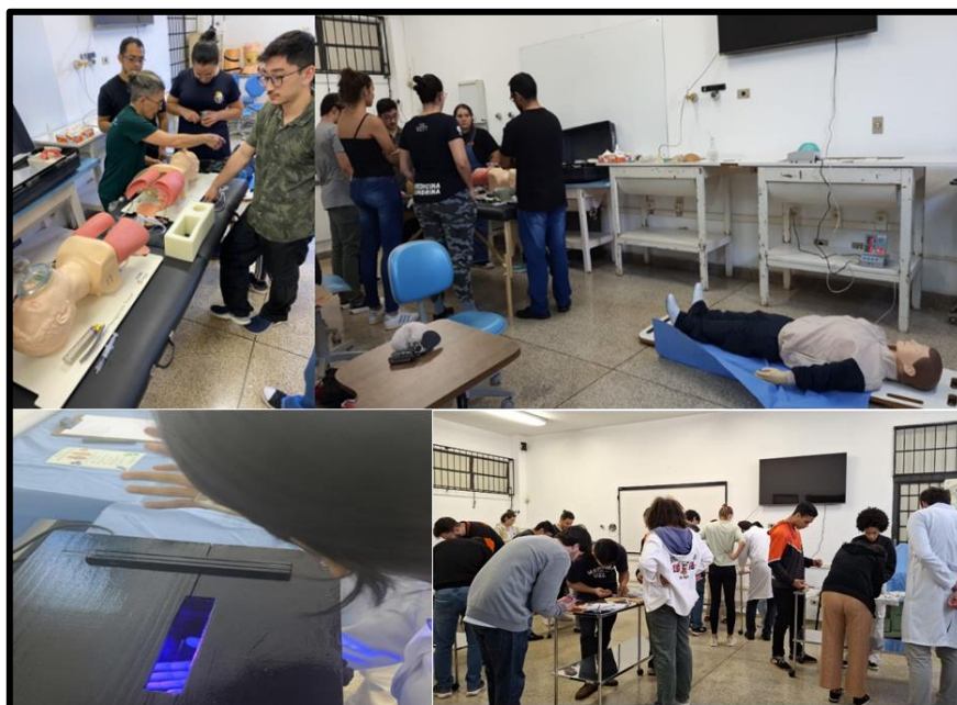
Figura 1: Laboratório de Técnicas Cirúrgicas

Legenda: Alunos de medicina realizando atividades práticas. Sob coordenação do Departamento de Clínica Cirúrgica.