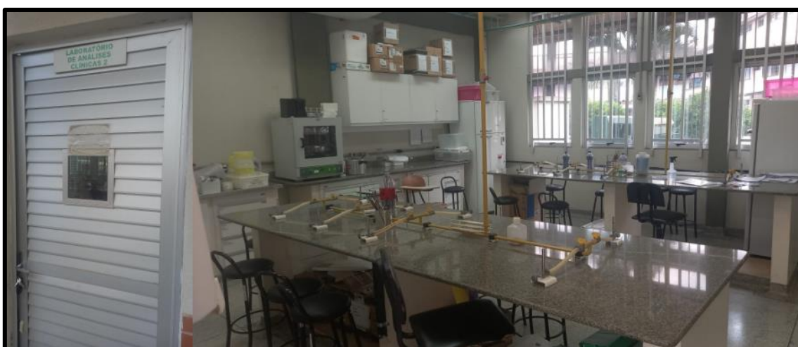
Figura 6: Laboratório Análises Clínicas 2, utilizado pelo curso de graduação em Farmácia.

Legenda: Laboratório utilizado para a realização de aulas práticas da área de microbiologia clínica e controle de qualidade. Legenda: Sob coordenação do Departamento de Patologia, Análises Clínicas e Toxicológicas.