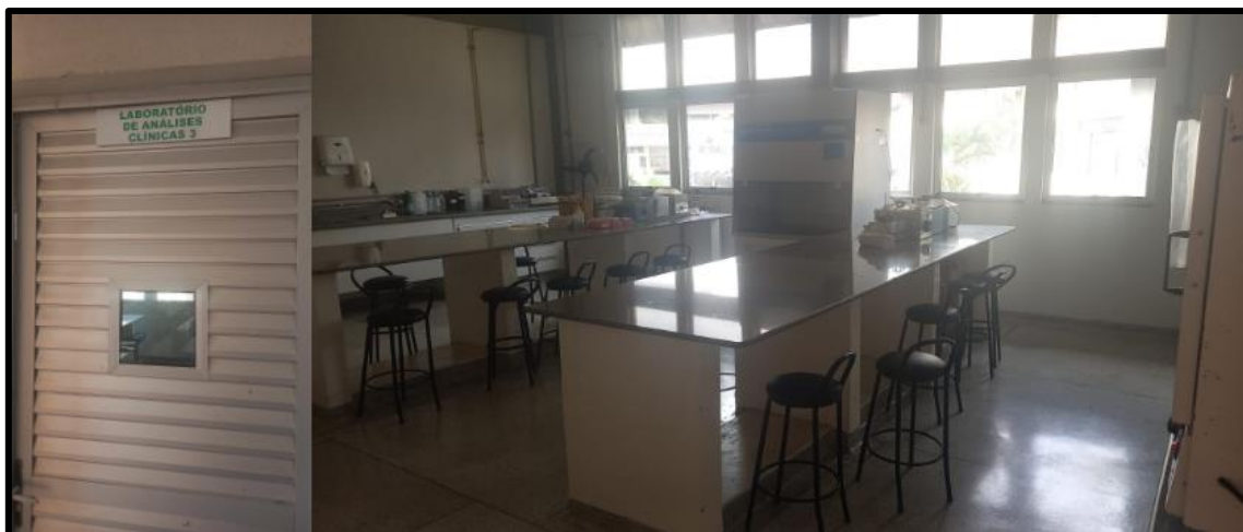
Figura 7: Laboratório Análises Clínicas 3 utilizado pelo curso de graduação em Farmácia.

Legenda: Sob coordenação do Departamento de Patologia, Análises Clínicas e Toxicológicas.