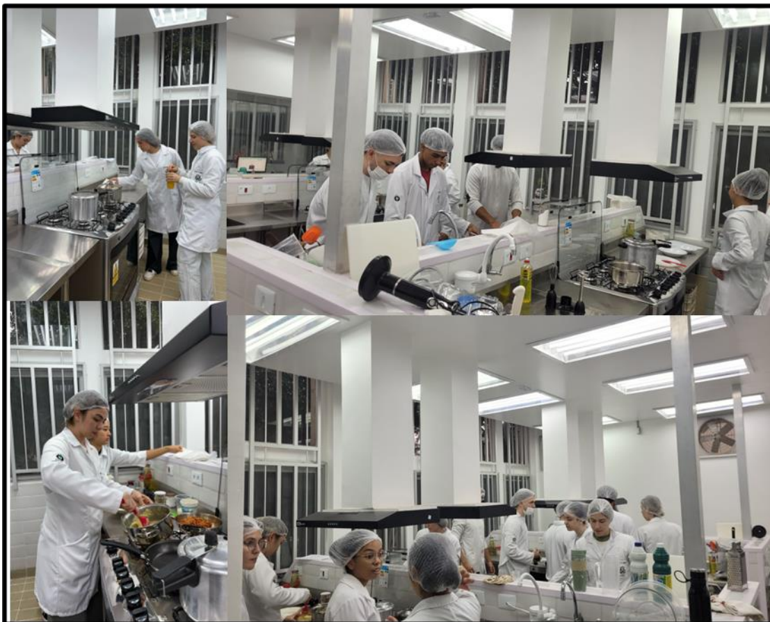
Figura 9: Laboratório de Nutrição e Dietética do curso de graduação em Nutrição.

Legenda: Laboratório inaugurado em 2024 utilizado para a realização das aulas práticas do curso de graduação em Nutrição. Sob coordenação do Departamento de Patologia, Análises Clínicas e Toxicológicas (área de nutrição).