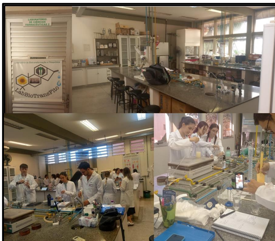
Figura 4: Laboratório de Ciências Farmacêuticas 2 utilizado pelo curso de graduação em Farmácia.

Legenda: Alunos do curso de graduação em Farmácia realizando atividades práticas. Sob coordenação do Departamento de Ciências Farmacêuticas.