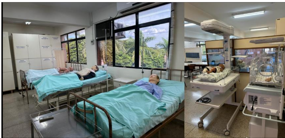
Figura 2: Laboratório de Habilidades Práticas de Técnicas de Enfermagem (LITE) utilizado pelos cursos de graduação em Enfermagem, Farmácia e Nutrição.

Legenda: Manequins utilizados nas aulas práticas. Sob coordenação do Departamento de Enfermagem.