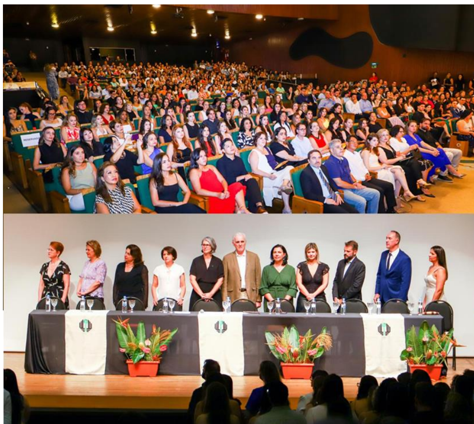
Legenda: Visão geral do Cine Teatro Ouro Verde e mesa de autoridades presentes durante a Cerimônia de Conclusão dos Programas de Residências do Centro de Ciências da Saúde.