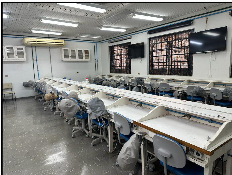
Figura 11: Laboratório de Habilidades Odontológicas II localizado na Clínica Odontológica Universitária - Centro.

Legenda: Sob coordenação da Direção do CCS e da Clínica Odontológica Universitária.