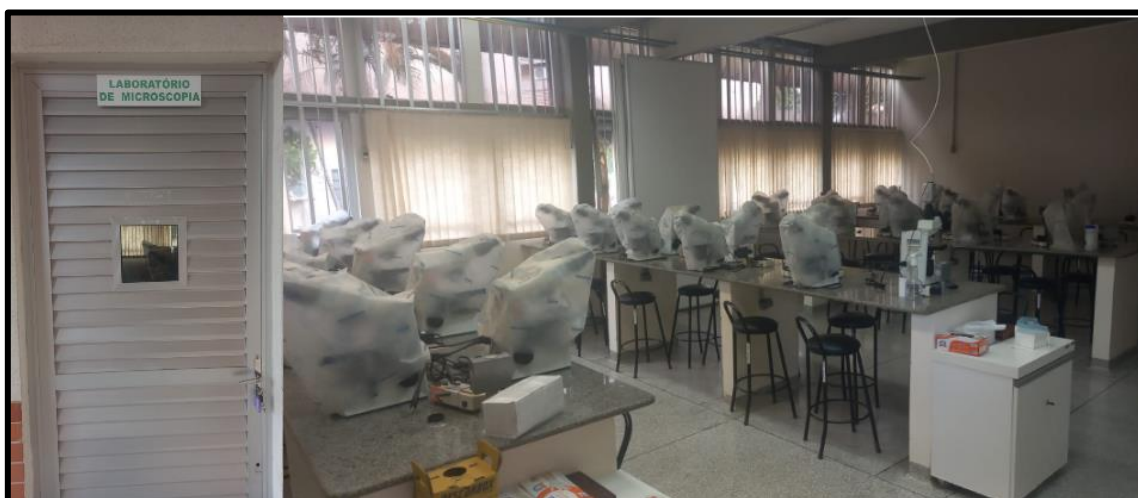
Figura 8: Laboratório de Microscopia utilizado pelos diversos cursos de graduação do CCS.

Legenda: Laboratório utilizado para a realização de aulas práticas da área de hematologia laboratorial e bioquímica clínica (análise de líquidos e fluidos biológicos). Legenda: Sob coordenação do Departamento de Patologia, Análises Clínicas e Toxicológicas.