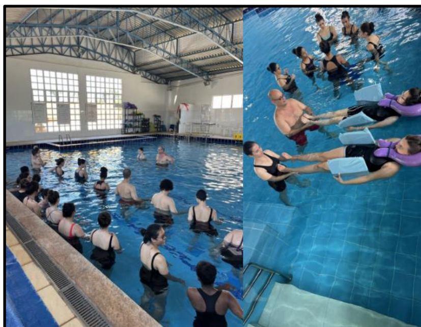
Figura 12: Centro de Fisioterapia Aquática "Prof. Paulo A. Seibert" utilizado pelo curso de graduação em Fisioterapia e em projetos de pesquisa vinculados a pós-graduação.

Legenda: Sob coordenação do Departamento de Fisioterapia.