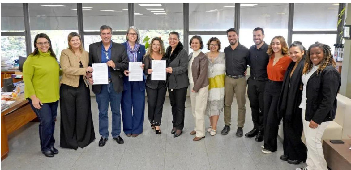
Figura 16: Assinatura do Termo de Compromisso entre a UEL e a Prefeitura Municipal de Londrina para a realização do Projeto de Extensão 02902 – CCS como agente de Transformação Social na Trilha Da Cidadania para Pessoas em Situação de Rua.

Legenda: Autoridades presentes: prefeito de Londrina, secretários, reitora e demais autoridades da UEL além de acadêmicos do curso de medicina da UEL.