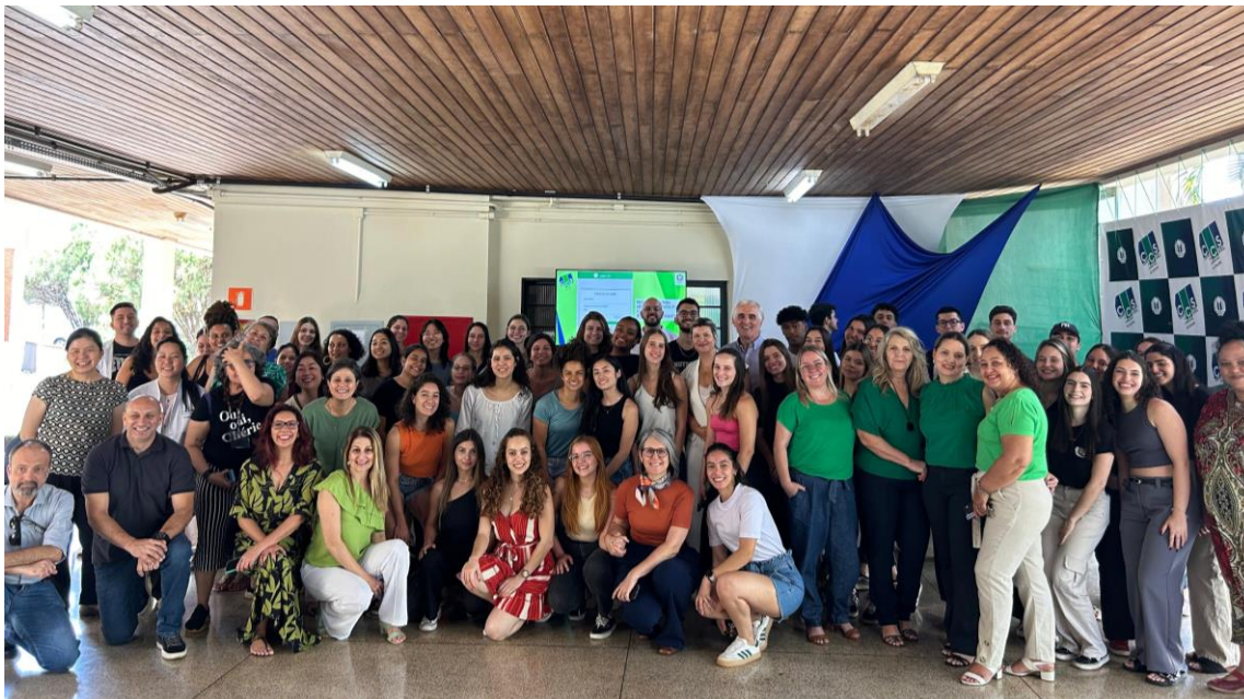
Figura 13: Cerimônia de Início do Projeto de Refeições Transportadas RU-CCS realizada em 01/10/2024.

Legenda: Cerimônia com a participação da Reitoria, Direção do CCS, SEBEC, Direção do HU, docentes e discentes e agentes universitários do CCS.