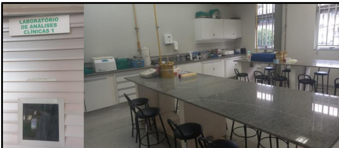
Figura 5: Laboratório Análises Clínicas 1 utilizado pelo curso de graduação em Farmácia.

Legenda: Laboratório utilizado para a realização de aulas práticas das áreas de bioquímica clínica e imunologia clínica. Legenda: Sob coordenação do Departamento de Patologia, Análises Clínicas e Toxicológicas.