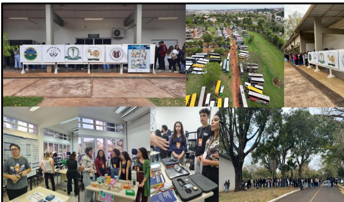
Figura 21: Feira das Profissões 2024, Cursos de Graduação do Centro de Ciências da Saúde no LABESC.

Legenda: Visão geral das instalações da mostra dos cursos de graduação do CCS no LABESC.