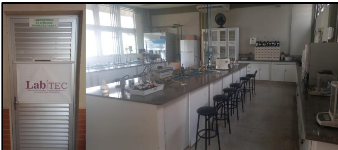
Figura 3: Laboratório de Ciências Farmacêuticas I utilizado pelo curso de graduação em Farmácia.

Legenda: Sob coordenação do Departamento de Ciências Farmacêuticas.