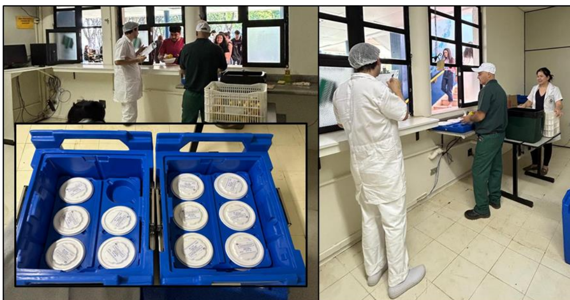
Figura 14. Local de distribuição das refeições transportadas do Restaurante Universitário em caixas térmicas.

Legenda: Cerimônia com a participação da Reitoria, Direção do CCS, SEBEC, Direção do HU, docentes e discentes e agentes universitários do CCS.